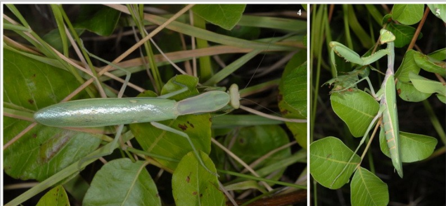
Figs 4-5. Habitus of Hierodula sp. from Thessaly, near Mount Olympus (Greece). 4) Dorsal view; 5) Lateral view (photos W. Wagner).