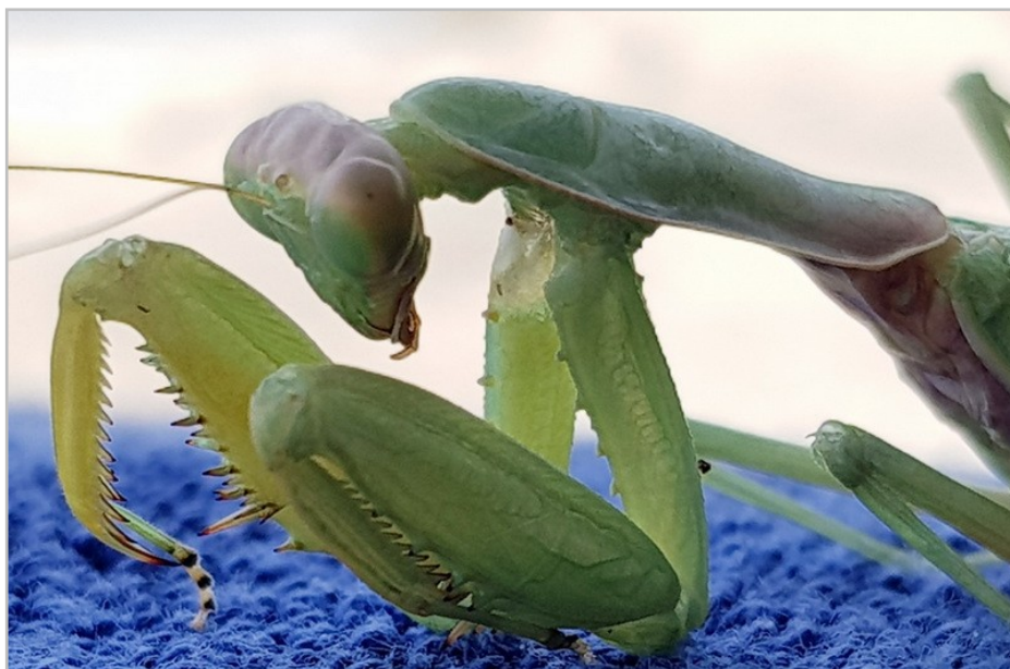
Fig. 6. Specimen of Hierodula sp. from Kassandra (Greece) with internal and discoidal spines on the inner side black only on the tip.